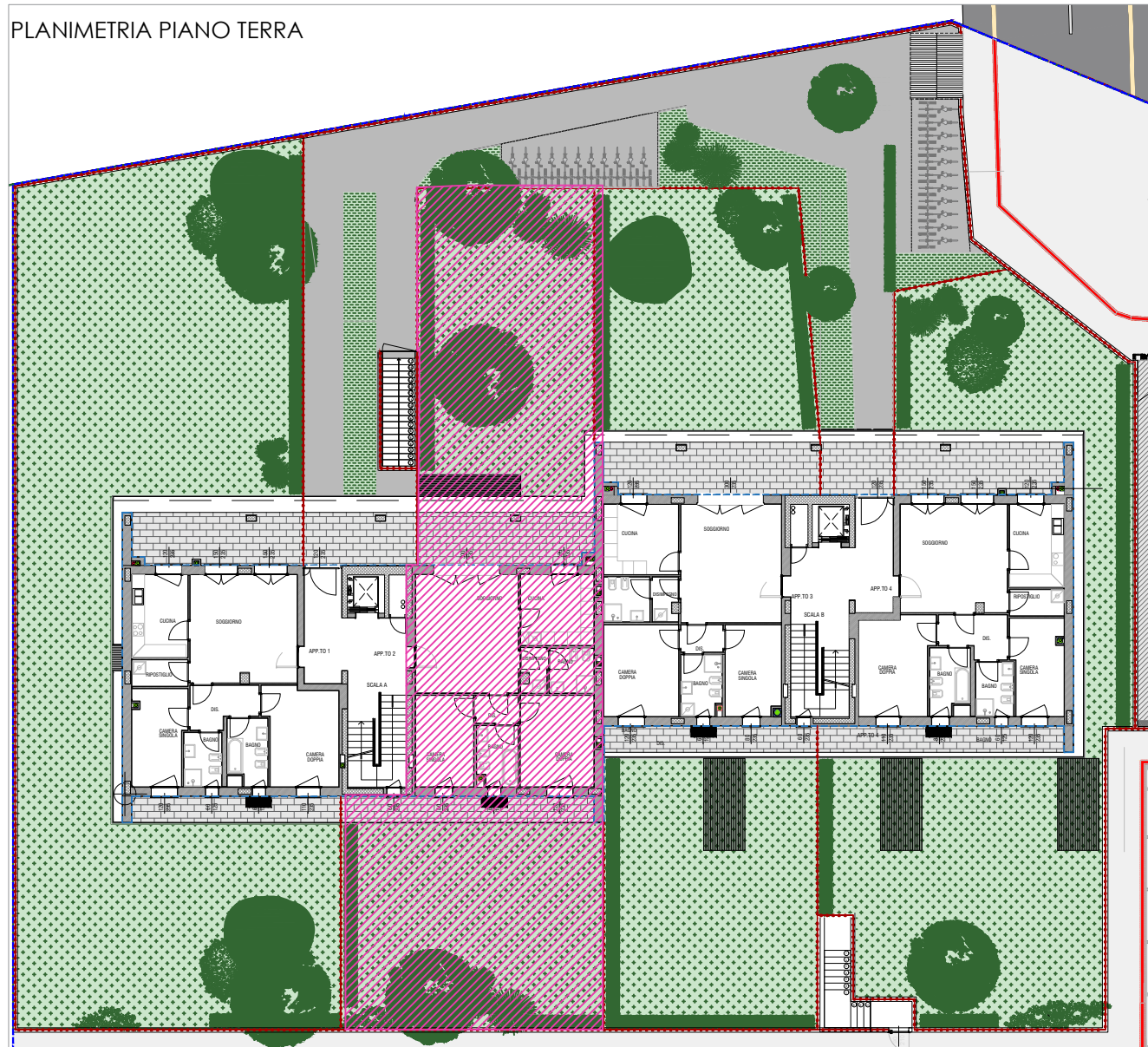
PLANIMETRIA PIANO TERRA