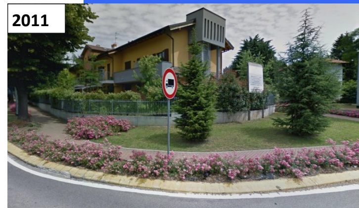
MARNATE (VA) – via Legnano,145-via Roma 4 villette a schiera e 5 alloggi di edilizia libera