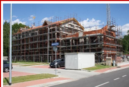
Marnate (VA) Via Morelli edificio 2A 11 alloggi Edilizia convenzionata Fine Lavori Luglio 2014