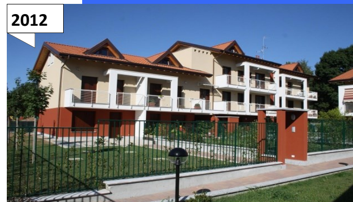
MARNATE (VA) via Morelli edificio 1B 11 alloggi di edilizia Convenzionata