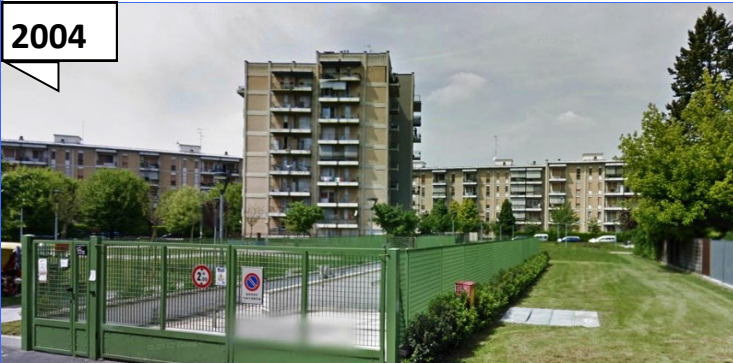
Milano Via Monte Popera / Piana n. 75 box (per 82 posti auto) Convenzione Programma Parcheggi 2000 del Comune di Milano