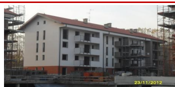
Cesano Boscone (MI) via Pasubio