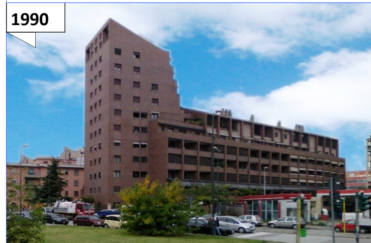
Milano Via Frà Riccardo Pampuri,2